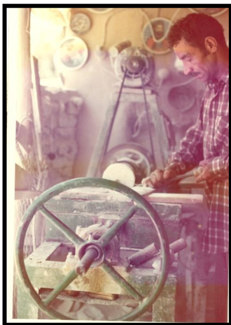
شکل ۳. دستگاه برقی سنگ تراشی

فن سنگ تراشی همچون دیگر هنرها و فن‌های دستی نیاز به وسایل و ابزار کار دارد.