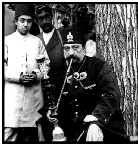
تصویر ۴. ناصرالدین شاه قاجار و قلیانچی جوانش در کنار او

تبلیغات اثر خود را می‌گذارد. اجانب مهاجم، حال می‌دانند که به دست هر ایرانی بالغ، از جوان ساده تا پیران دنیادیده و باسواد و بی‌سواد، یک قلیان و تنباکو قرار دارد. در مسافرت‌ها هم کاروانسراهای بین راه قلیان عرضه می‌کنند. ضمن آنکه در کجاوه‌های مسافرتی قلیان هست و نوکری مدام در بین کجاوه‌ها رفت و آمد می‌کند و قلیان آماده می‌سازد؛ «قلیانچی» نامی که سلاطین قجر آن را همگانی ساختند و از مشاغل پردرآمد قجری محسوب می‌شد. (دیولافوا، ۱۳۷۱: ۷۶-۷۸ و تصویر ۴)