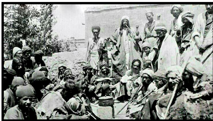
تصویر ۸. گروه قلندران و درویشان و مریدان در حال قلیان کشی، دوره قاجار

دلم از دست تنباکو سیاه است اگر باور نداری نی گواهست اگر خواهی بینی جسم بشکاف دل فایز مثال نی تباه است