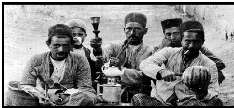
تصویر ۶. جوانان دوره قاجار ایرانی در زمان فراغت با قلیان و چای و هندوانه

تا سحر قلیان کشیدن از روی غم و اندوه، نالیدن از عشق برای جوانان، پناه‌بردن به قلیان از سوی جوانان نامزد شده، نداری و قلیان شکسته و احساس برابری چوپان قلیان‌کش با چوپانی حضرت موسی که در این دویستی‌ها شاهد آن هستیم، نشان از جنگ و هجوم فرهنگی حساب شده دارد. چنین هجومی به فرهنگ یک ملت بی سابقه است. (تصاویر ۵ تا ۹)