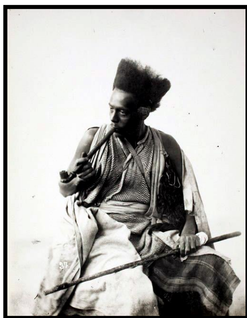
تصویر ۱. مرد ترکمن در حال کشیدن چیق در دوره قاجار

«توتون بسیار مصرف می‌شود و علاقمندان بسیار دارد. همه جا حتی در مساجد، مردم ایستاده و نشسته به کشیدن توتون مشغولند ..... ایرانی‌ها از آماده کردن توتون برای کشیدن سر در نمی‌آورند و آن را مانند سایر گیاهان خشک می‌کنند. در بساط دستفروشان و خرازی‌ها تنباکو بسیار یافت می‌شود اما توتون اروپایی را بسیار دوست دارند و آن را انگلیس تنباکو می‌نامند زیرا اغلب، انگلیسی‌ها آن را به ایران می‌آورند». (همان: ۲۷۳)