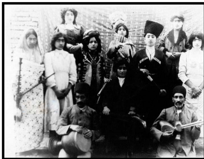
تصویر ۹. گروه مطربان قاجاری که قلیان هم دارند.

هلاکوکو، هلاکوکو سر قلیون و تنباکو تنباکویه گل نم کن آتش بر سرش کم کن تا ما بکشیم دودی آواره شویم زودی