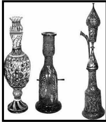
تصویر ۲. انواع قلیان ایرانی

قلیان‌های کوچک، قلیان‌های مسافری و قلیان‌هایی که کوزه آنها با کدوی رونده ساخته می‌شد و «چلیم» ۱ نام گرفته بود؛ از شمال تا جنوب ایران را طی کرده و شاعران «قلیان‌کش» و «چلیم چاق‌کن» را به سرودن اشعاری در وصف این ابزارهای تدخین ترغیب کرده بود. آنها این‌گونه عاشقانه ترانه می‌سرودند: