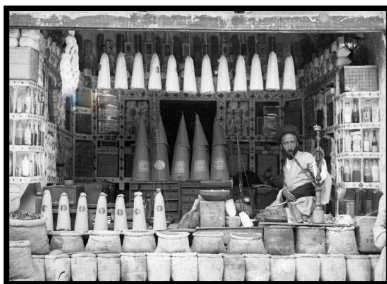
شکل ۷. دکاندار بازار که قند، روغن و توتون می‌فروخت و قلیان هم می‌کشید

زنان روستایی گریخته از ده تخریب شده، در کنار همین بازار، کارشان به دوختن و عرضه کیسه توتون رسید. «ماژور تالبوت» در سفر ناصرالدین‌شاه به لندن، با پرداخت رشوه و پادرمیانی «دروموند وُلف» ۱ وزیر مختار انگلیس موفق می‌شود تا امتیاز خرید و فروش تنباکو را از آن خود سازد و «رژی» را به وجود