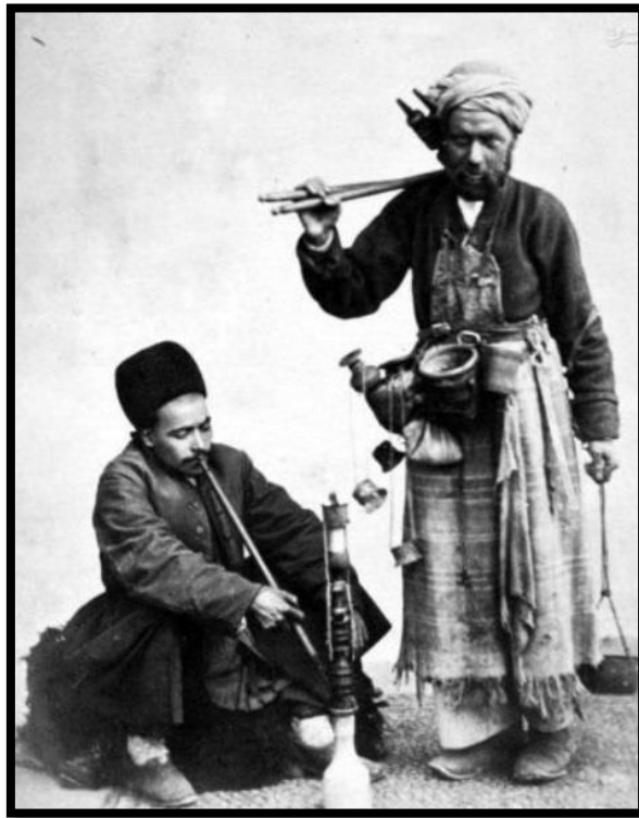
تصویر ۵. قلیانچی دوره گرد

«تقریباً خانه‌ای نیست که در آن قلیان نباشد و اگر کسی قلیان نداشته باشد متمدن به حساب نمی‌آید، دست بالا به یک چنین آدمی با تعجب می‌نگرند و یا اینکه تاسف‌خوران و تحقیرکنان از او روی برمی‌گردانند. بدون قلیان هیچ کاری صورت نمی‌گیرد؛ مهمان‌نوازی، مذاکره، معامله، عروسی، عیش، ناهار، هدیه، شعر خوب، همه قلیان می‌طلبیده است.» (نجمی، ۱۳۶۴: ۵۹)